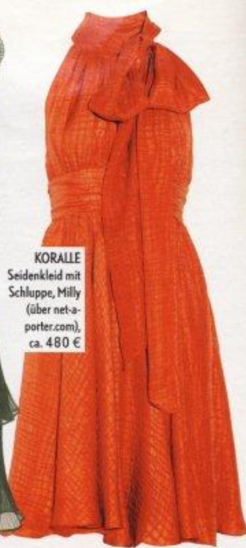
KORALLE Seidenkleid mit Schluppe, Milly (über net-a- porter.com), ca. 480 €