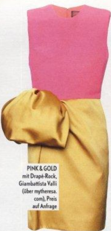
PINK & GOLD mit Drapé-Rock, Giambattista Valli (über mytheresa. com), Preis auf Anfrage