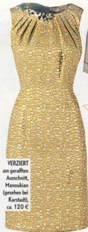
VERZIERT am gerafften Ausschnitt, Manoukian (gesehen bei Karstadt), ca. 120 €