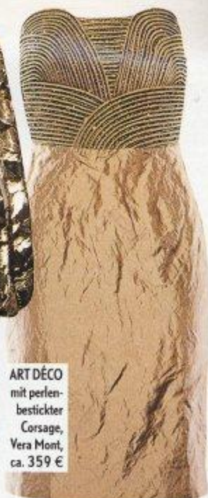
ART DÉCO mit perlen- bestickter Corsage, Vera Mont, ca. 359 €