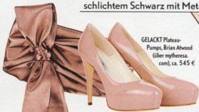
GELACKT Plateau- Pumps, Brian Atwood (über mytheresa. com), ca. 545 €