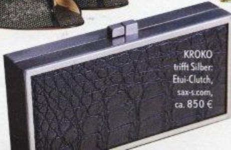
KROKO trifft Silber: Etui-Clutch, sax-s.com, ca. 850 €