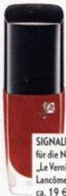
SIGNALROT für die Nägel: „Le Vernis“, Lancôme, ca. 19 €