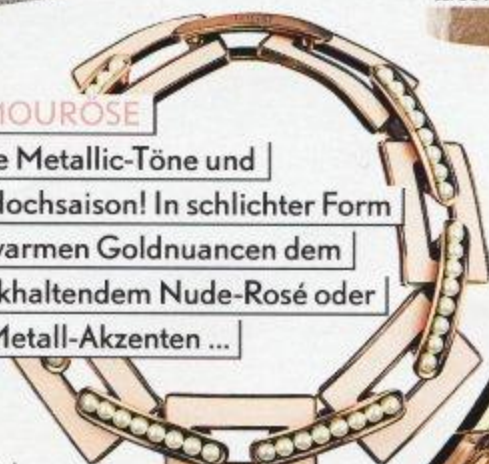
SPEKTAKULÄR Collier, Chris- tian Dior, Preis auf Anfrage