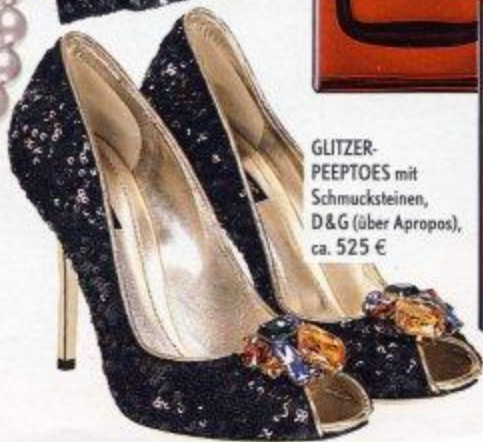
GLITZER-PEEPTOES mit Schmucksteinen, D&G (über Apropos), ca. 525 €