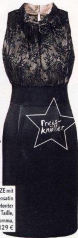
SPITZE mit Seidensatin und betonter Taille, Comma, ca. 129 €