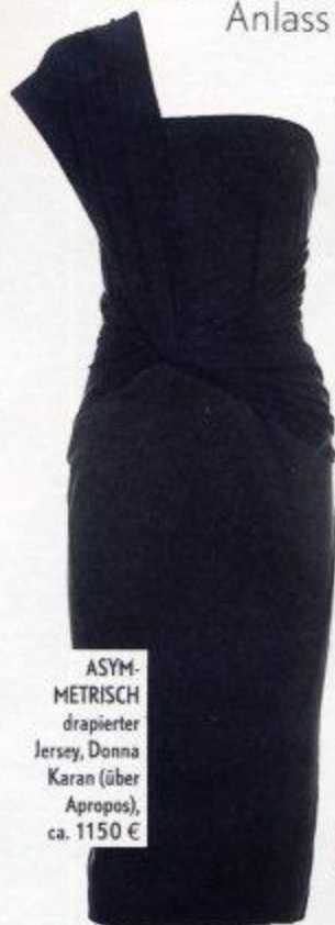
ASYM-METRISCH drapierter Jersey, Donna Karan (über Apropos), ca. 1150 €