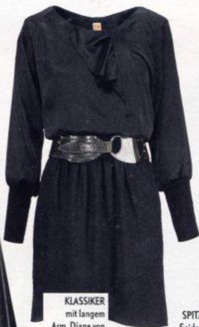
KLASSIKER mit langem Arm, Diane von Furstenberg (über Apropos), ca. 400 €