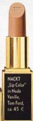
NACKT „Lip Color“ in Nude Vanille, Tom Ford, ca. 45 €