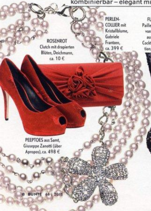
ROSENROT Clutch mit drapierten Blüten, Deichmann, ca. 10 €