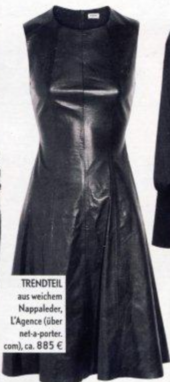
TRENDTEIL aus weichem Nappaleder, L'Agence (über net-a-porter.com), ca. 885 €