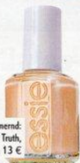
ZART und schimmernd: Nagellack in Naked Truth, Essie, ca. 13 €