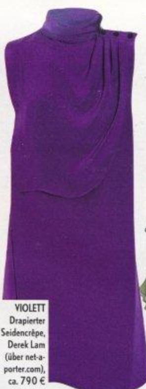
VIOLETT Drapierter Seidencrêpe, Derek Lam (über net-a- porter.com), ca. 790 €