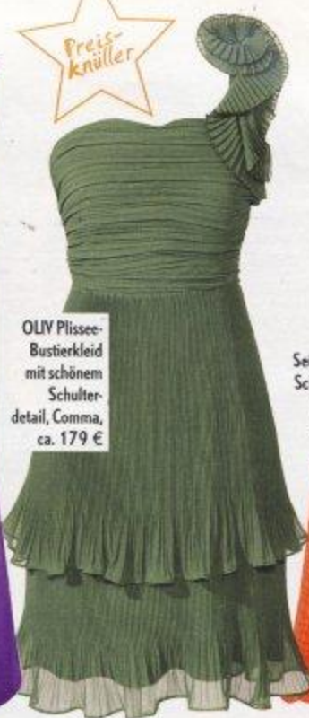
OLIV Plissee- Bustierkleid mit schönem Schulter- detail, Comma, ca. 179 €