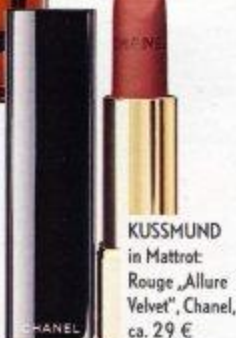
KUSSMUND in Mattrot: Rouge „Allure Velvet“, Chanel, ca. 29 €