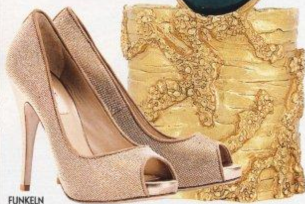
FUNKELN Glitzerpumps, Valentino (über my theresa.com), ca. 540 €