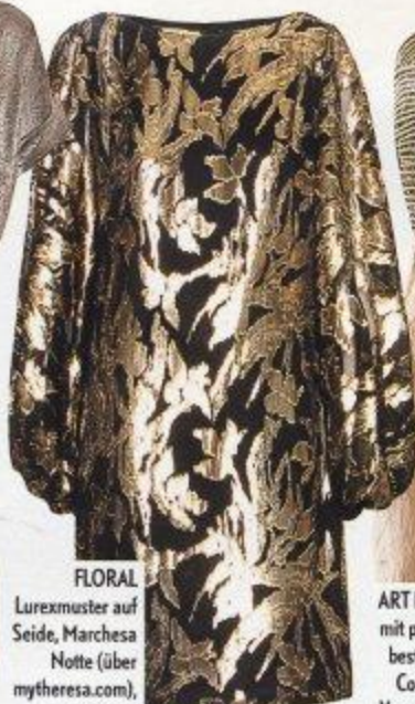
FLORAL Lurexmuster auf Seide, Marchesa Notte (über mytheresa.com), ca. 798 €