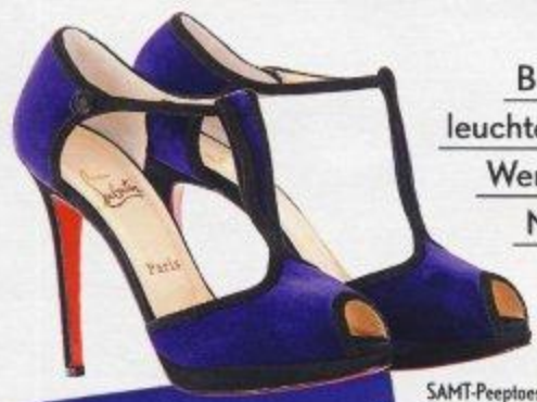
SAMT -Peep toes, Christian Louboutin (über mytheresa. com), ca. 625 €