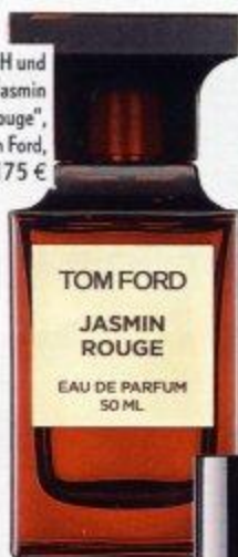
SINNLICH und würzig: „Jasmin Rouge“, EdP, Tom Ford, ca. 175 €